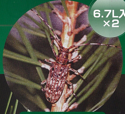
マツノマダラカミキリ